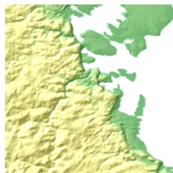
Figure 1.1 : Réponse d'un navigateur Web à une demande à WMS

Avant de passer aux tests de conformité et à l'optimisation des services, vous devez établir une méthode d'accès aux OWS. Plusieurs applications client conçues spécialement pour accéder à un ou à des services particuliers (par exemple, WMS, WFS) sont disponibles. Certaines de ces applications sont présentées à titre d'exemples dans la section 1.2.2. Toutefois, avant d'examiner les applications client propres aux services, il importe de souligner que vous pouvez accéder à la plupart des services Web conformes à l'ICDG au moyen d'un navigateur Web ordinaire, à jour et conforme aux normes.